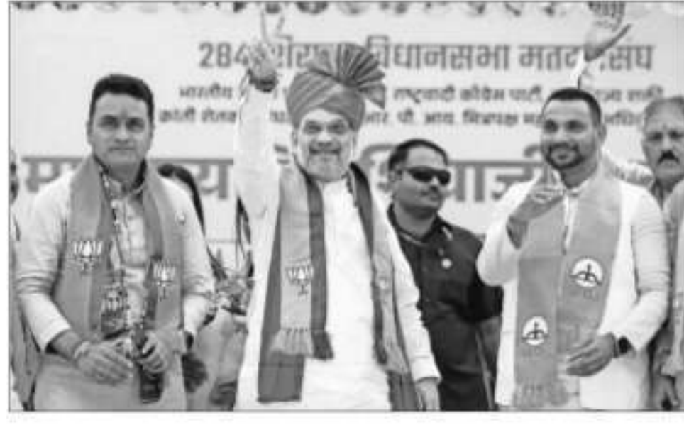
Union home minister Amit Shah shows a victory sign during a public meeting for the Maharashtra assembly elections, at Shirala in Sangli on Friday

"On November 20, across Maharashtra, there will be voting, and you people have to take a decisive stand. One and a half